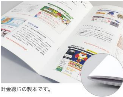
針金綴じの製本です。